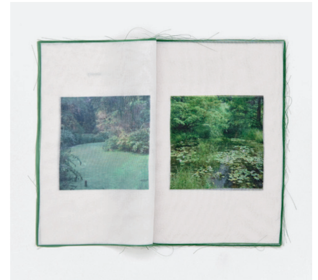
Organised Scenery: la couture s'effiloche comme des brins d'herbe folle, métaphore d'une nature finalement indomptable.